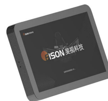
触控屏/平板一体机